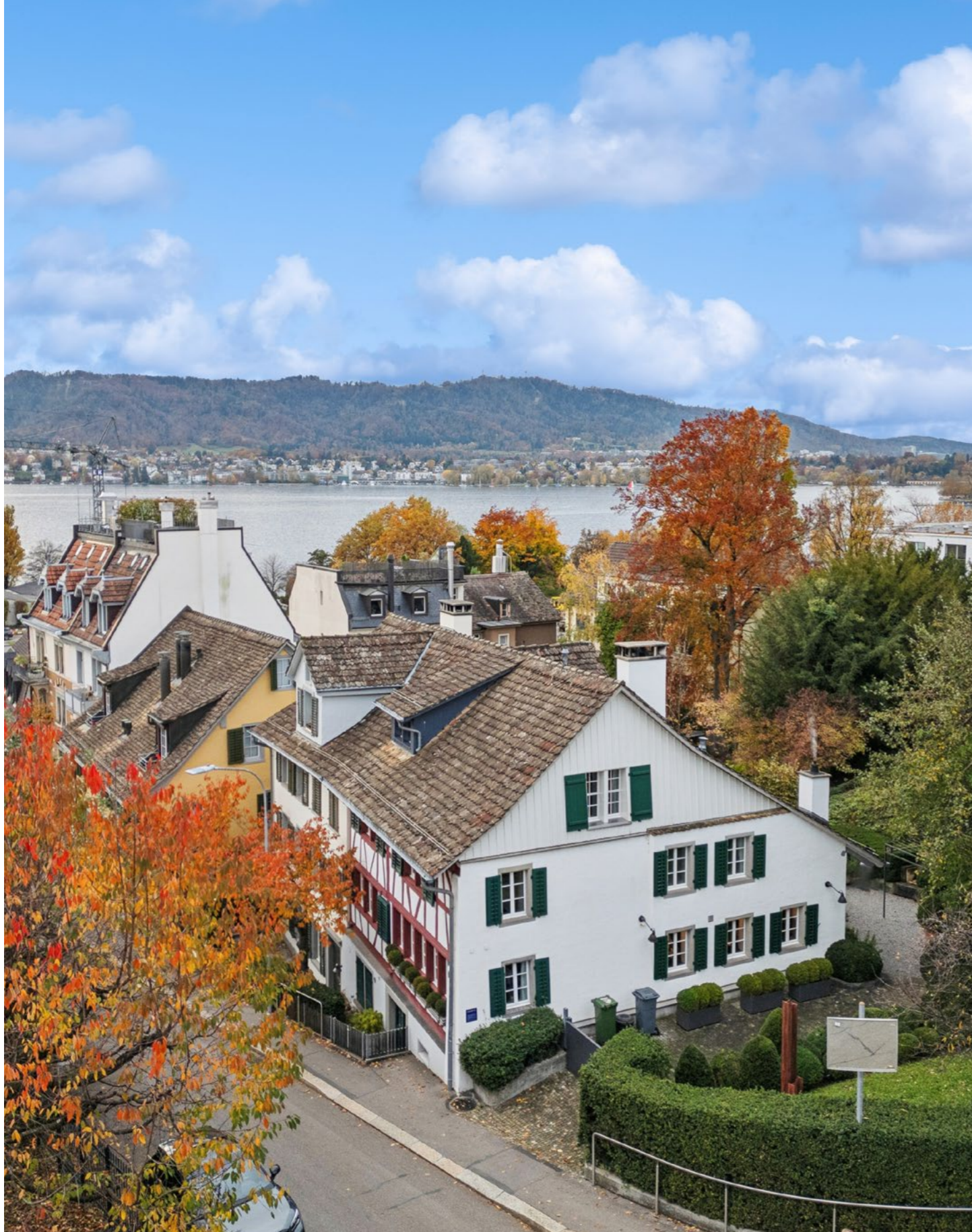
Historisches Riegelhaus mit modernem Innenausbau